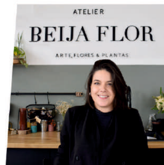
PONTE DA BARCA

Não desistam e apostem na formação, porque se há algo que nos faz crescer, através da formação desenvolvemos competências e conhecimentos, que são fundamentais para evolução do negócio.