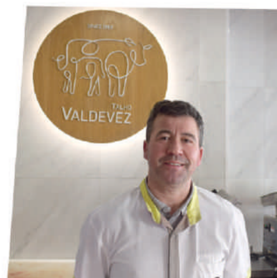
ARCOS DE VALDEVEZ

Deixo uma mensagem de dinamismo, positiva para que não baixem os braços e continuem a trabalhar com vista a satisfazerem os nossos clientes. Quanto maior for o crescimento dos nossos negócios, maior é o desenvolvimento da economia local.