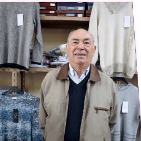
ARCOS DE VALDEVEZ

A ACIAB tem como mote o reconhecimento e a identificação de iniciativas de sucesso, cujo o âmbito é a promoção ao Associado, divulgando as empresas, negócios, serviços e produtos, atividades que promovam o empreendedorismo e a inovação, assim ao longo das edições do Infoempresarial,