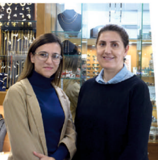
ARCOS DE VALDEVEZ

Temos de ter fé, acredito que estas terras, Arcos de Valdevez e Ponte da Barca vão continuar a trabalhar muito bem até porque o turismo está na onda e temos de aproveitar isso. Temos de aproveitar o bom momento do turismo e fazer das nossas fraquezas forças.