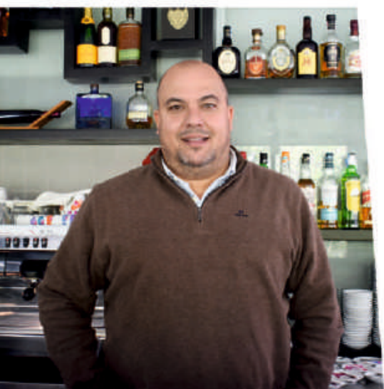
PONTE DA BARCA

Deixo uma mensagem de esperança e dinamismo para que os negócios possam ter sucesso. O sucesso que merecem. Não podemos baixar os braços e temos de ser positivos.