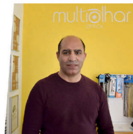
PONTE DA BARCA

A minha mensagem vai no sentido de resistirem a esta crise, porque isto vai passar. O mais importante é a persistência e continuar em frente, apelamos à colaboração de todos os comerciantes e entidades de referência para a dinamização do comércio tradicional.