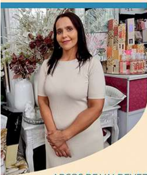
ARCOS DE VALDEVEZ

Todos nós, empresários temos as nossas vertentes e todos queremos que as nossas empresas singrem. Temos um parceiro importante que é a ACIAB e que é fundamental para o nosso crescimento e por isso temos de aproveitar os meios que a ACIAB nos dispõe. Todos nós devíamos associar-nos uns aos outros, deve existir comunicação entre empresas e empresários, porque todos fazemos parte de um mercado global.