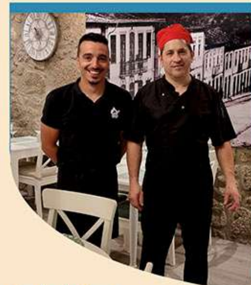
Ponte da Barca

Quem desejar comer comida bem confeccionada num espaço calmo e rústico, mas ao mesmo tempo moderno, nós somos a solução ideal. Temos um fantástico espaço de restauração, muito acolhedor para receber famílias ou grupos de pessoas e também temos acessos para pessoas com limitações motoras. Quem gosta de boa comida, com boa carne, bom peixe e bom vinho, deve vir aqui ao Varela porque vai ficar satisfeito.