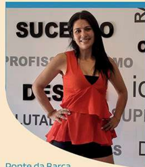
Ponte da Barca

A mensagem vai no sentido de não deixarmos de acreditar nos nossos sonhos, ir atrás deles, acreditar e lutar por eles. Acho que com esforço, dedicação e muito empenho, todos os sonhos se podem tornar realidade acreditando. No meu caso, é graças aos meus clientes que eu consigo ter este sucesso, por toda a confiança que depositam em mim. As nossas novas instalações em Ponte da Barca foram um sonho que se tornou realidade.