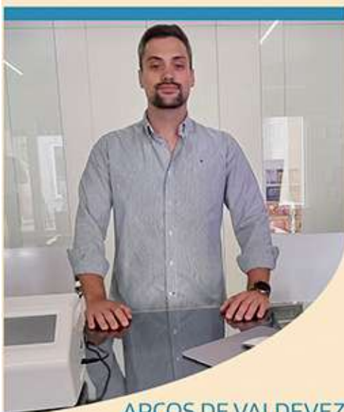
ARCOS DE VALDEVEZ

Uma mensagem de dinamismo, devemos sempre tentar agradar aos nossos clientes e tentarmos estar sempre disponíveis para eles, porque os nossos clientes são a razão da nossa existência.