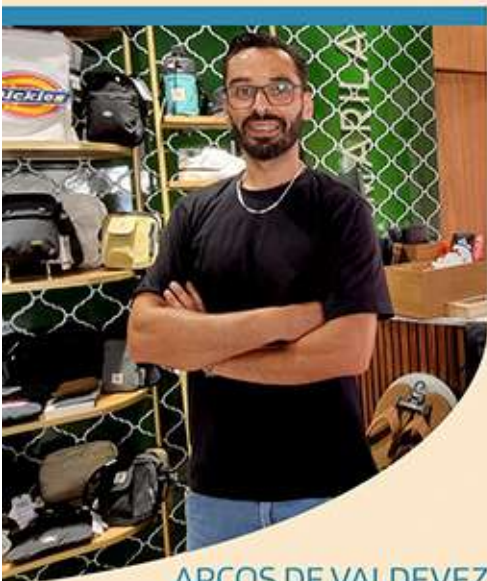
ARCOS DE VALDEVEZ

A ACIAB tem como mote o reconhecimento e a identificação de iniciativas de sucesso, cujo o âmbito é a promoção ao Associado, divulgando as empresas, negócios, serviços e