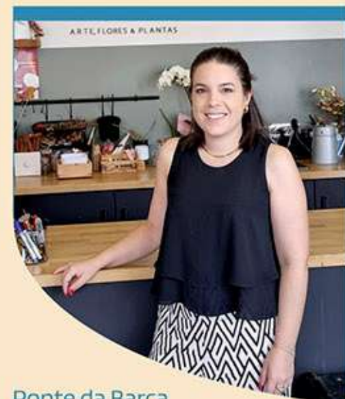
Ponte da Barca

Como empresária, acredito firmemente no poder da inovação, da resiliência e do trabalho em equipa. Cada desafio que enfrentamos é uma oportunidade de